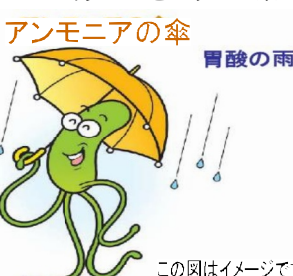
この図はイメージです