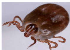
フタトゲチマダニ